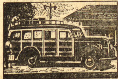
Opção entre motores de 95 e 85 cavalos, ou motor Hercules-Diesel.

No instante em que adquirir um caminhão Ford, o senhor começará a fazer economia. Economia em trabalho, porque Ford transporta maiores cargas... economia em dinheiro, porque Ford proporciona surpreendente rendimento... economia em tempo, porque Ford é extremamente veloz. Por isto Ford é o caminhão preferido em todo o Brasil; por isto deve ser, tambem, o seu caminhão. Experimente um Ford, no trabalho: admire sua potência, constate seu rendimento, verifique sua capacidade. Escolherá um Ford.