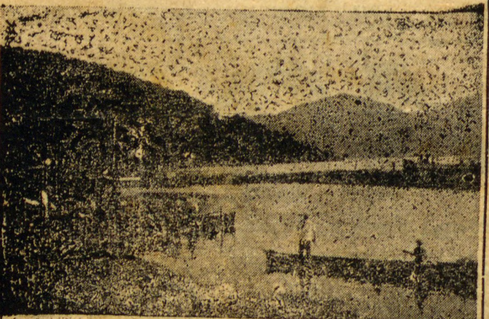
Outro aspecto da linda bahia de Guaratuba, vendo-se varias embarcações que tanto enfeitam

As temporadas, alli, são tradicionais e divertidas, além de salutareas e hemfazijas á saude.