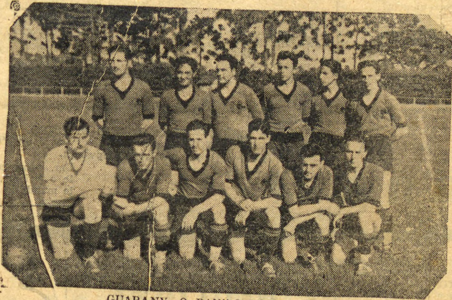
GUARANY, O BANDO VICTORIOSO

a primeira phase termina sem alteração na contagem.