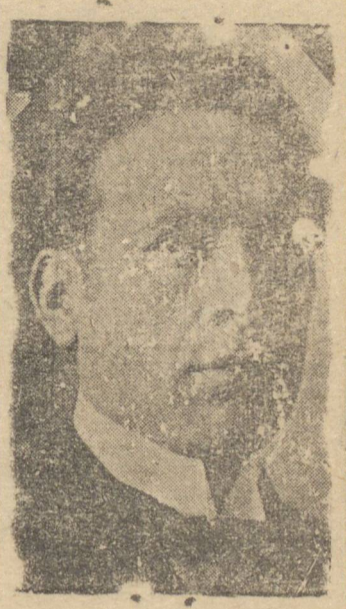
SR. FLORES DA CUNHA