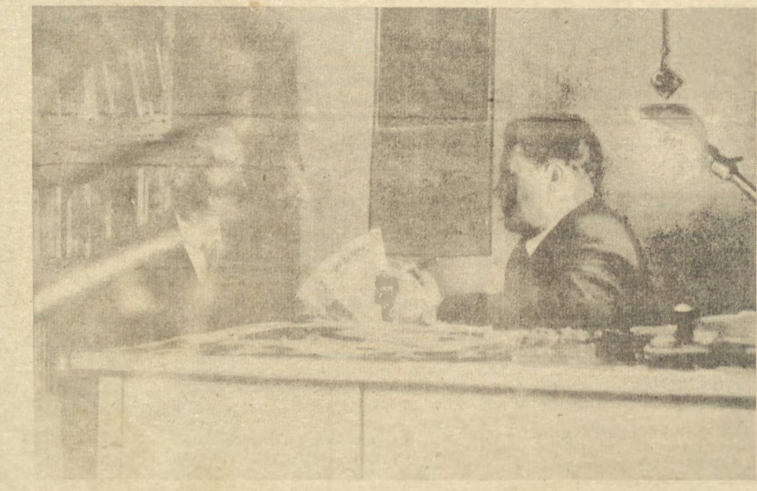
O LÍDER ANTI-NAZISTA NO BRASIL FALANDO AO "DIÁRIO DOS CAMPOS"

RIO, 31 (A.N.) — O Embaixador Jefferson Caffery, foi alvo ontem na Associação Brasileira de Imprensa, de significativa homenagem, por motivo da passagem do sexto aniversario de sua estada nesta Capital, como chefe da representação dos Estados Unidos junto ao nosso governo. Falaram cerca de vinte oradores. Representantes dos diversos setores da vida publica, intelectual e artistica do País e das ministerios de Estado, com exceção do sr. Marcondes Filho, que se encontra em São Paulo, estiveram presentes.