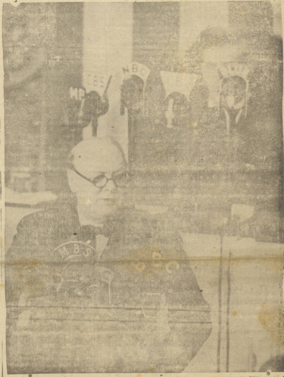
O PRIMEIRO MINISTRO CHURCHILL, FALANDO NO PARLAMENTO BRITANICO