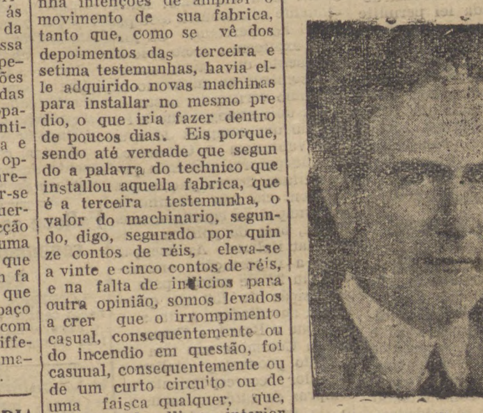
S. PAULO, 5 (D.) — Procedente de Belém do Pará, chegou hoje a esta capital o sr. Oswaldo Aranha, Ministro do Exterior.

Procedente de Belém do Pará, chegou hoje a esta capital o sr. Oswaldo Aranha, Ministro do Exterior.