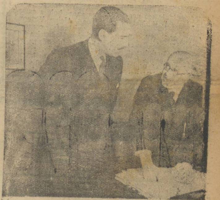
LONDRES, agosto (diário) — Sir Kingsley Wood, ministro do ar da Grã Bretanha e organizador das imponentes manobras aviatorias que se estão realizando na Inglaterra, posa para a imprensa em companhia do sr. Guy de la Chambre, ministro da Aviação do governo francês, cuja visita a Londres se prende ao estabelecimento de uma estreita colaboração entre as forças aeronauticas das duas grandes potencias demericanas.

terá carater violentissimo e assinalará o inicio de uma campanha de propaganda visando a incorporação de Dantzig ao Reich.