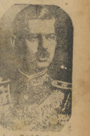
BUCAREST, 10 (D.). — Acusadas de propaganda em favor da extinta "Guarda de Ferro" (organização fascista rumena), foram condenadas á pena de um ano de campo de concentração 2 mulheres. Essas sentenças resultaram do advento de uma vasta campanha contra a organização de modelo fascista desde que o governo rumeno descobriu uma conspiração para o assassinio do rei Carol, em 17 de junho ultimo.