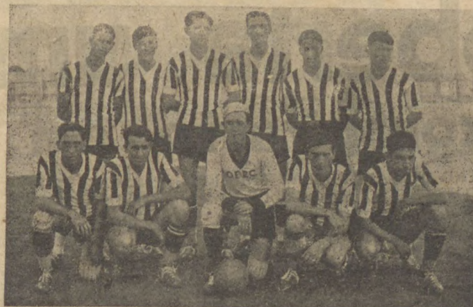
Operario, o campeão da cidade, de 1936

FERIR-SE-HA DOMINGO P ROXIMO, NESTA CIDADE, NA CANCHA DE VILLA OFFICINAS