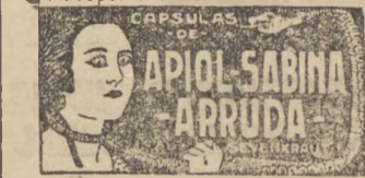
A venda em todas as boas Farmacias e Drogarias. Tubo 95.

Segundo os preceitos da moderna farmacopeia para a manipulação das Capsulas Sevenkraut, são os seus componentes distilados por uma das maiores fabricas da Alemanha, e consultando as exigencias da farmacopeia Brasileira.