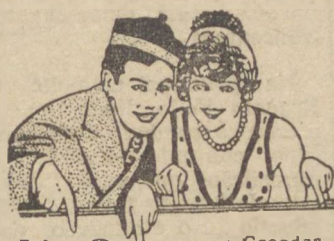
A's Senhoras Casadas Viúvas

TOKIO, 10 (T.O.) — O embaixador japonês em Moscou, sr. Shichida, declarou, ao chegar a Tokio, perante os representantes da imprensa, que teve a impressão em Moscou, de que progredem a grandes passos as negociações diplomaticas entre o Japão e a Russia, conforme lhe declarou o sr. Molotoff.