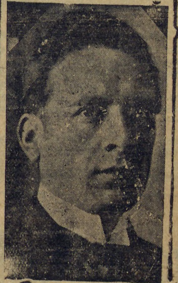
SR. FLORES DA CUNHA

reunião de todos os governadores dos Estados. O conclave, que será presidido pelo sr. Getúlio Vargas, terá por finalidade examinar-se a situação do paiz, assentando-se as directrizes a serem traçadas em face dessa mesma situação.