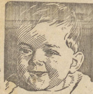
Esta pequena joia

DIÁRIO DOS CAMPOS, sus-tingido com atencioso convite, far-se-á representar na festa esportiva em apreço pelo seu Diretor Geral de Esportes.