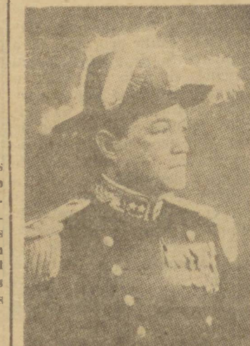
Almirante Aristides Guilhem, Ministro da Marinha

funcionamento de sua aparelhagem. Em 1912, em virtude das agressões sofridas, o Brasil aceita o repto dos países do "eixo". Uma tarefa de máxima responsabilidade, é então entregue à nossa Armada, nas missões de defesa da nossa costa, ações no Atlântico Sul, em cooperação com as forças aliadas, especialmente para garantir as rotas da navegação mercante. Da maneira mais brava e eficiente, nessa Marinha vem cumprindo todas essas missões, e isso o provam os pronunciamentos e testemunhos varios, inclusive o de altos comandos das esquadras aliadas, no Atlântico. Ao mesmo tempo, nas oficinas, nos arsenais, e através de aquisições no exterior, prosseguiu no seu ritmo intenso a atividade pelo aumento, mais do que nunca necessário, de nosso poderio naval.