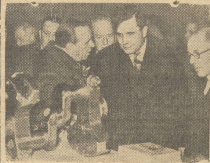
WENDELL WILKIE FALANDO AOS JORNALISTAS

Hitler e Hirohito, e primeira tarefa não deixara de ser responsável para nós, que não devemos fugir ao dever de executá-la. Devemos, pelo menos, nos esforçar para levar-lhes os três benefícios: 1) — Uma educação melhorada. 2) — O progresso econômico. 3) — Maior liberdade política. Wendell Wilkie acrescentou que as novas bases do problema de após-guerra devem ser inspiradas antes no futuro numano do que pelo retrocesso dos valores e que a solução deve vir do povo. O sr. Wilkie disse atualmente: