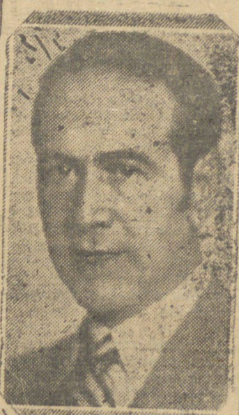
SR. OSVALDO ARANHA

RIO 23 (A.N.) — Por motivo da solução do conflito de fronteiras entre o Peru e o