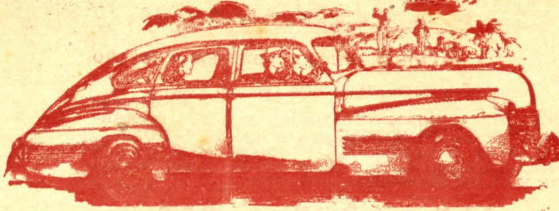
Acima mostramos um Sport Sedan De 1940

Em 1940 o "PONTIAC" foi o primeiro em linhas, elegancia e distincão. Este ano continua sendo o vanguardeiro no Estilo, no Conforto, na Potencia e na Economia.