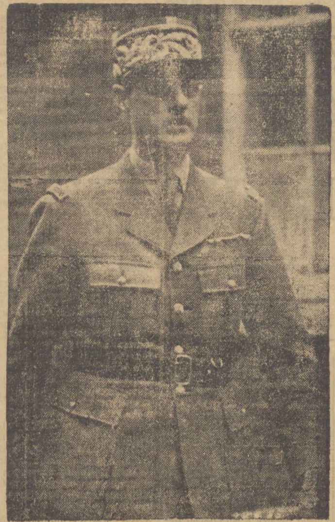
GENERAL CHARLES DE GAULLE

ROMA, 26 — "O Governo francês de Vichy estaria conspirando com o general De Gaulle, para reunir num bloco os territórios franceses da Africa afim de oferecer vigorosa resistencia a qualquer "eventual intervenção estrangeira" — diz o magazine fascista "La Resegna Italiana". E continua a revista: "O plano seria o de constituir com as possessões africanas francesas, sob a bandeira dos chamados "franceses livres" comandados por Charles De Gaulle e com as possessões inglesas, um gigantesco bloco, que não somente poderia correr em socorro do Sudão anglo-gipio, como ser tambem usada numa offensiva contra os territórios italianos".