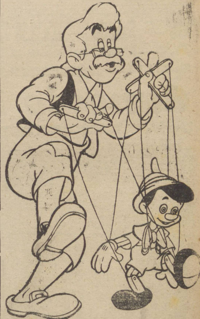
A 2ª maravilha toda colorida e falada em português, de Walter Disney, apresentada na R.K.O. Radio!