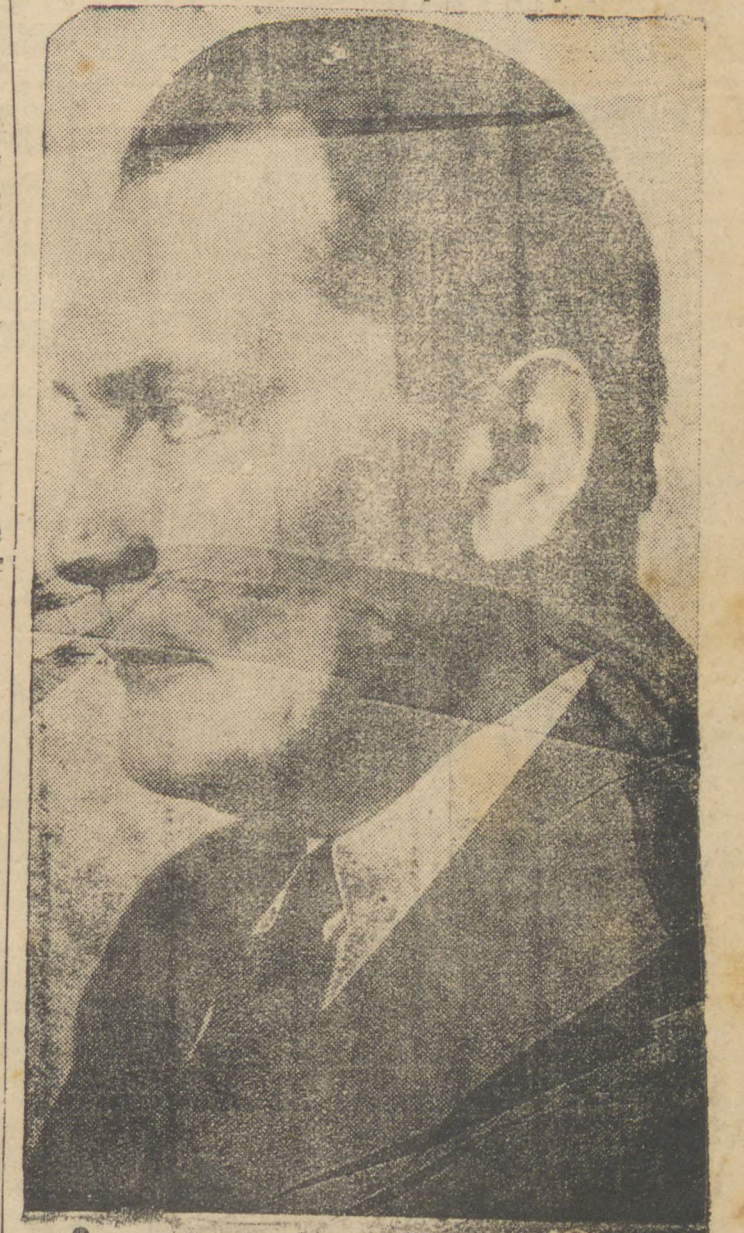
Marechal Hermann Goering

grossos e médios. Durante o combate aereo que se seguiu foi abatido um dos aviões inimigos. A despeito do fogo pesado das baterias anti-aereas, voltaram todas as máquinas às suas bases com exceção de uma, cujo parafuso até esta hora não foi possível precisar."