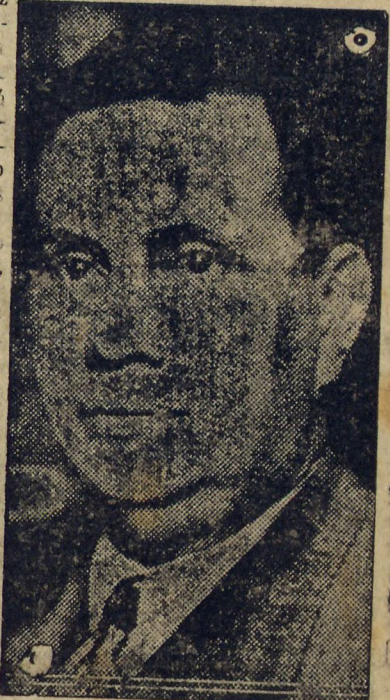
Sr. Manoel Ribas, governador do Estado, voltou á capital

Um órgão de imprensa, mais desassombrado, chega a perguntar mesmo quando esborraço levá-lo na transação desses exquisitos julgadores de contas.