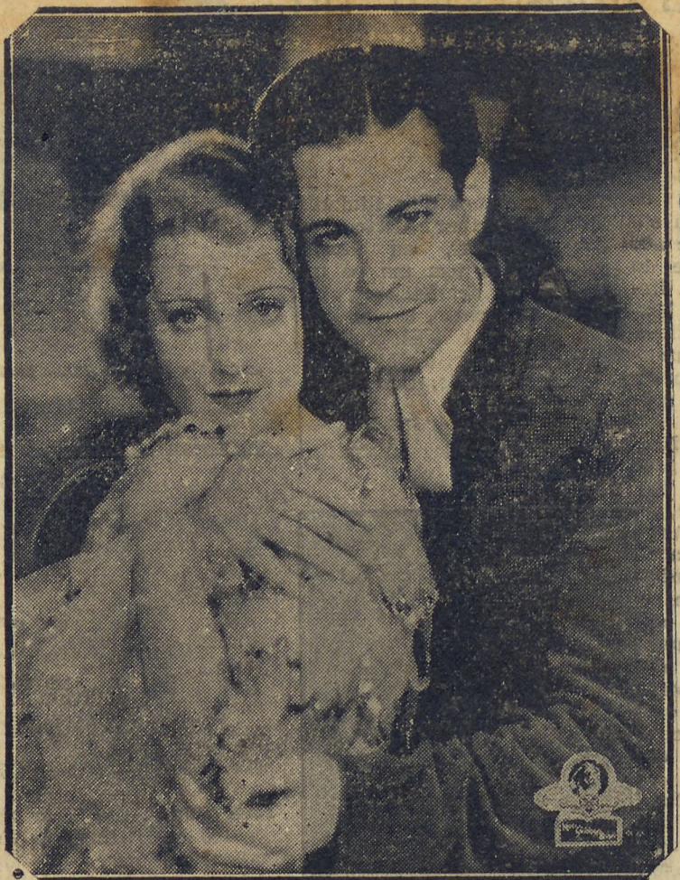
2ª feira — Paramount

VARIEDADES DE BRO DWAY Universal, com varios Artistas JARDINEIROS DA INFANCIA — comedia