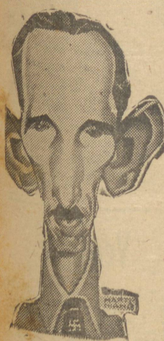
PLÍNIO — ANTES, DURANTE E DEPOIS...

PORTO ALEGRE, 5 (A. N.) — A classe estudantil local está preparando um grande comício de protesto e condenação ao nazi-fascismo, a realizar-se no dia 11 do corrente, data em que transcorre mais um aniversário da bárbara, covarde e maldadada tentativa integralista preparada no Rio de Janeiro para implantar o totalitarismo no Brasil, por meio do golpe traçoado contra o Palácio Guanabara, quando as "verdes" pretenderam apunhalar, em sua própria residência, o presidente Getúlio Vargas.