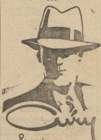
O Chapeo Dos Quarenta Milhoes! Único distribuidor em Guarapuava: "BASAR GUARAPUAVA" o maior varejista da praça

BAILE DO GRÊMIO DA PRIMAVERA DIA 25 Será a 25 do atual que o Grêmio da Primavera, a distinta agremiação feminina do nosso "set" social brindará o mundo elegante da "Princesa dos Campos com outra das suas inolvidáveis noitadas dançantes. E essa notícia vem empolgando a todos os associados e admiradores da entidade mais simpática entre as mais simpáticas, pois em todas as retentivas ainda permanecem indelévelmente gravadas as seqüências das maravilhosas festividade proporcionadas pelo Grêmio da Primavera ao nosso mundo social mais chic. A orquestra Guarani abrihantará com seu ritmo impecável as danças, prometendo contagiar a toda a gente com o "caliente furor" de suas execuções incomparáveis.