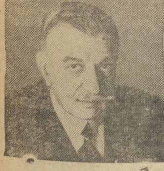
Sr. Charambalos Limalopoulos, ministro grego em Londres

CAIRO, 28 (Reuters) — O ministro da Grã Bretanha, Anthony Eden, enviou hoje a seguinte mensagem de Moscou ao primeiro ministro grego, por ocasião da passagem do terceiro aniversário da invasão da Grécia pelas tropas italianas. "Se bem que os acontecimentos no Mediterraneo ain-