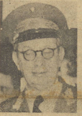
GAL. GOIS MONTEIRO sob a formula de uma solução nacional e conciliante com as mais variadas corren-

RIO, 7 (PRESS PARGA) — "O Globo", em sua última edição de hoje, divulga o seguinte: "Surgiu esta manhã a notícia de que o gal. Góis Monteiro promoveu em sua residência uma reunião de generais, afim de trocar ideias com todos sobre a atualidade política e assentar medidas pelas quais seria o assunto das eleições encaminhado duma forma nacional, evitando-se maiores lutas e inquietações. Logo depois dessa reunião, a nossa reportagem saiu o campo, apurando que realmente algo existe ou tem havido naquele sentido. Não só de hoje, mas de há dias, realmente, o gal. Góis Monteiro vem reunindo, para conservar e entendimentos, onde a situação é analisada detalhadamente, vários almirantes, generais e brigadeiros, no intuito de resolver o "impasse" político e