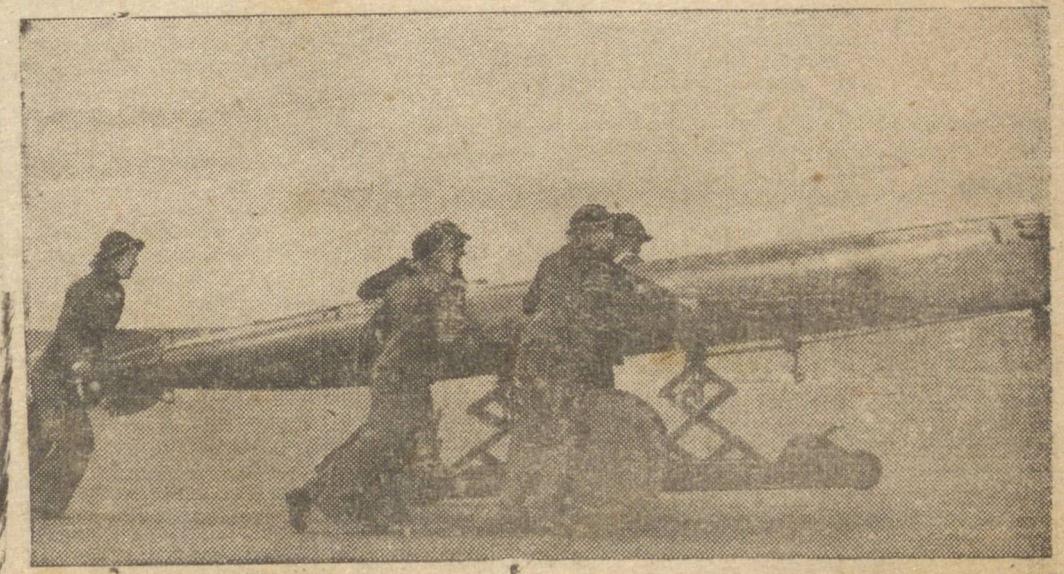
O HOMEM, A MAQUINA E A BOMBA — PARA MARTELAR AS LINHAS DE SUPRIMENTO DE ROMMEL — Os bombardeiros "Boston" de construção americana, estabeleceram belo record junto á RAF no Oriente Medio, onde atacam incessantemente as posições avançadas do inimigo. Na fotografia vemos um a bomba, ao ser içada para um bombardeiro "Boston" no deserto.

do-se, para julho do ano proximo, o início da sua produção.