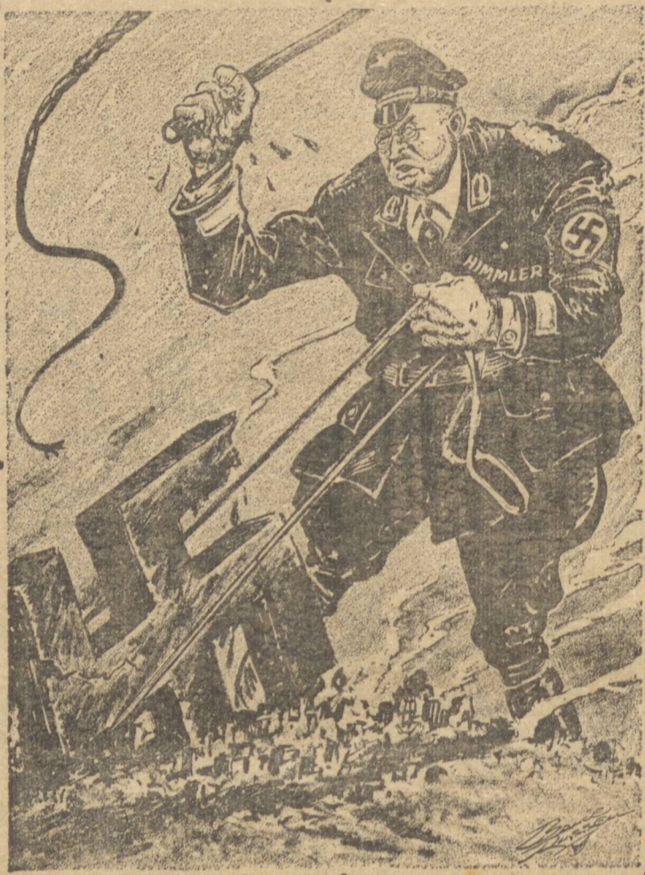
O BRAÇO FORTE.

PROCEDENTE DO TRIANGULO MINEIRO SENDO UM LOTE DE REPRODUTORES ZEBU DAS RACAS: INDO-BRASIL, GUZER T, NELORE e GIR. INTERESSENTES PODERAO TER A LIVRE ESCOLHA DE SUA PREFERENCIA DOS DITOS ANIMAIS, POR PREÇOS BEM ACESSIVEIS: INFORMAÇÕES PELO FONE 644