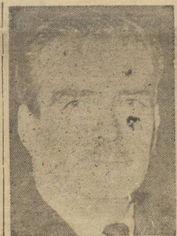
ANTHONY EDEN da Inglaterra

O “Daily Mirror” escreve: “A declaração mais surpreendente é que se tenham tomado providências para dar a conhecer simultaneamente a Londres, Washington e Moscou os resultados da conferência.” WASHINGTON, 30 (R.) — O “Washington Post” escreve hoje o seguinte: