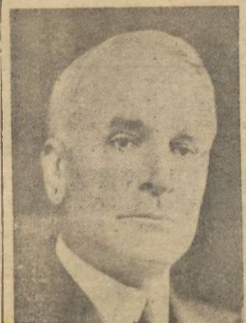
CORDELL HULL dos Estados Unidos

Devemos esclarecer aos nossos leitores, aliás, que nos serviremos desse interequo para, respeitando os sentimentos que nos inspiram aqueles dois dias santificados, ativar os trabalhos pertinentes à remodelação que estamos fazendo em nossas máquinas, visando a melhorá-las cujos efeitos o nosso jornal já apresenta, mas que ainda não se acha concluída.