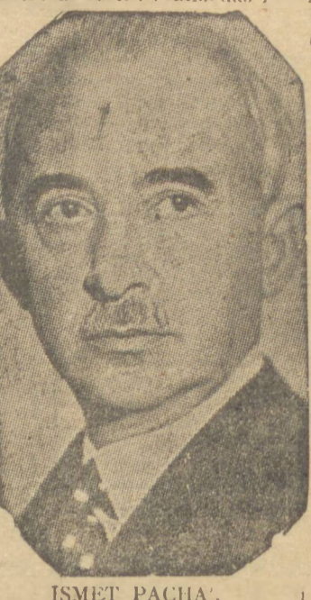
ISMET PACHA, presidente da Turquia

ANGORA, 30 (U. P.) — A Turquia comemorou hoje o vigésimo quinto aniversário da fundação da República. Entre as festas realizadas realizadas efetuou-se uma parada militar que durou nada menos de 3 horas. Na ocasião foram exibidas nas ruas da capital turca novos equipamentos bélicos de fabricação britânica, todos pelo sistema de empilhamento e arrematamentos. Observou-se entre outros os turcos não mostraram os "Sherman" norte-americanos, as tropas de tanquistas e outros aerotécnicos que modernizam o Exército da Turquia. Essa mudança tribuída nos meios bélicos como uma precaução em virtude da presença ainda de notáveis perseguidos nazistas.