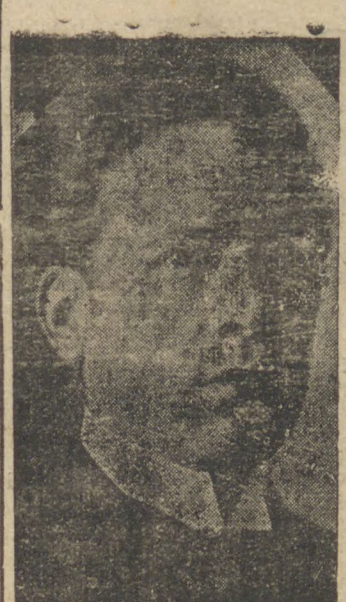
Gaspar Dutra, ministro da Guerra.

Flores da Cunha RIO, 23 (D.) — Informam de Porto Alegre que o general Eurico Gaspar Dutra, ministro da Guerra, falando á imprensa, desmentia formalmente que cogitasse de encontrar-se com o sr. Flores da Cunha. O gel. Eurico Dutra na Estancia do S. Getulio Vargas