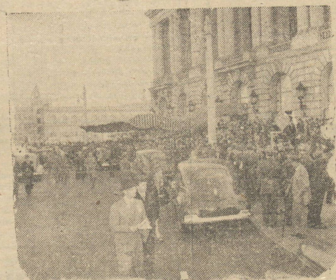
Vista do Teatro da Ópera de San Francisco, no momento em que saíam os delegados das Nações Unidas, depois de uma sessão plenária da Conferência Internacional.