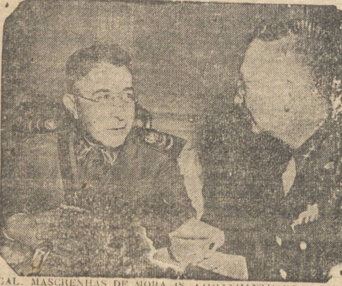
GAL. MASCARENHAS DE MORAES, COMANDANTE DA F.E.B.