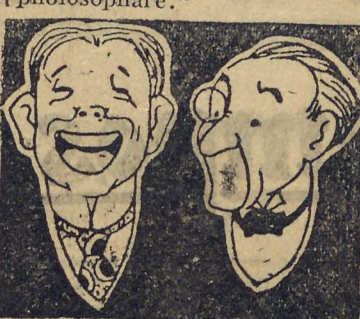
Os dois agentes do Rio. O de monóculo conta a outro o "volume" do stock de casemiras roubadas

reos. Ao que o Joaquim acrescentou: "Primum vivere, deinde philosophare."