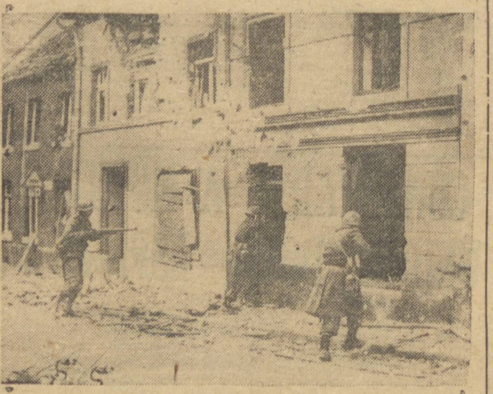
Soldados americanos dão caça na cidade alemã de Schmidt, a franco-atiradores alemães que ficaram depois da retirada das tropas nazistas.

mundial, assim como uma troca de idéias a respeito, aprovou-se por unanimidade o projeto lei apresentado pelo ministro José Serrato, propondo à Assembléa Geral a declaração de guerra às potências do "eixo" e autorização legislativa para aderir às declarações das Nações Unidas assinadas em Washington, no dia 1.º de janeiro de 1942.