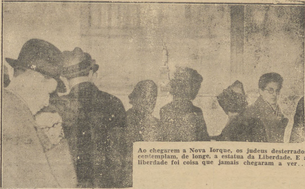
Ao chegarem a Nova Iorque, os judeus desterrados contemplam, de longe, a estatua da Liberdade. E a liberdade foi coisa que jamais chegaram a ver...

A situação na Palestina — Assistencia economica contra a Inglaterra