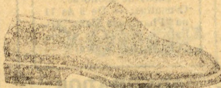
LUX (Referencia 1043) Boscál em vinho e preto.