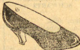
Raso em verniz preto. Todo picotado e forrado de branco. Salto Luiz XV. Mesmo modelo em pellica preta finissima... 30$000