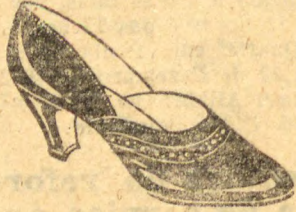
Superior verniz preto, raso, moderno: com picote ao redor da gárgia: forrado de branco. Salto Luiz XV cubano, alto, 32 a 40... 29$000

Calçados mexicanos Em todas as cores 20% menos do que em qualquer outra casa