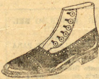
ROCHA (Referencia 4301). Em verniz preto, artigo finissimo para passeios e soirées