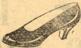
Offerta especial: Superior pellica preta envernizada, forrado de branco. Salto Luiz XV cubano alto e 4 de altura, de 32 a 40... 28$000