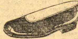
Superior, verniz preto forrado de branco, salto de sola baixo, bom acabamento; de 32 a 40... 19$000