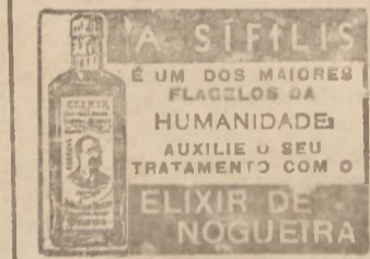
A SIFILIS É UM DOS MAIORES FLAGELOS DA HUMANIDADE. AUXILIE O SEU TRATAMENTO COM O ELIXIR DE NOGUEIRA

que os rebanhos bovinos em geral das demais regiões do país, vêm sofrendo sérias reduções; considerando que é preciso evitar o abate de fêmeas do rebanho leiteiro; considerando, por fim, a necessidade de proporcionar aos criadores maior numero de bovinos fêmeas, para produção de novilhos, resolve: 1.º — Proibir nos Estados do Rio de Janeiro, São Paulo, Mato Grosso, Goiás, Minas Gerais e Distrito Federal a matança de qualquer fêmea bovina destinada à industrialização de conservas e charque, pelo período de dois anos, a partir de 1.º de agosto de 1943; 2.º — Permitir a matança de fe-