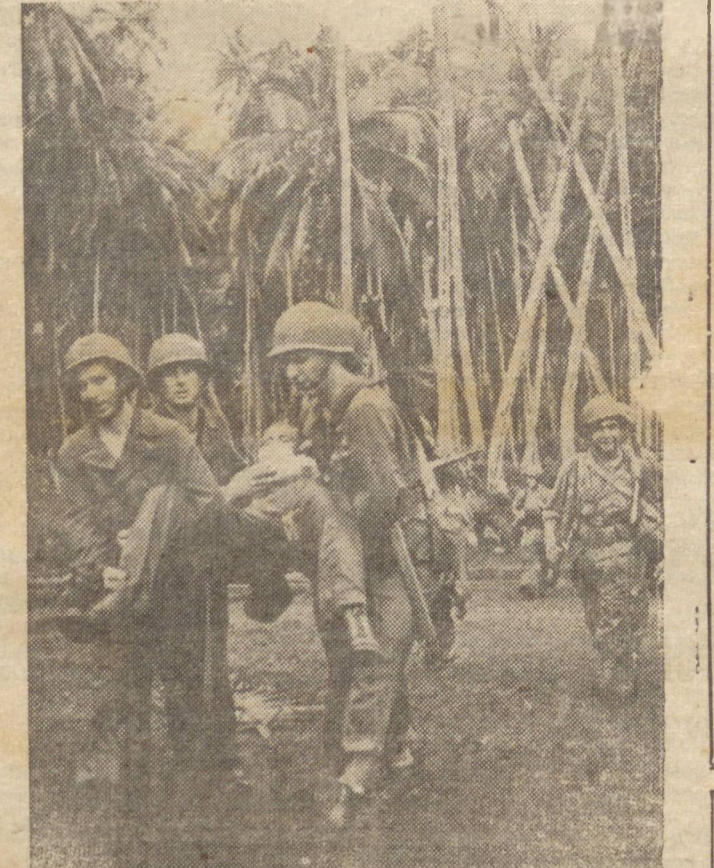
FERIDO EM COMBATE — A luta heroica dos soldados norte-americanos no Pacifico (em-lhes valido os mais calorosos elogios por parte do povo estadunidense. Enfrentando as maiores dificuldades os valentes soldados e Tio Sam levam de vencida a resistencia niponica. Na fotografia um soldado americano ferido em batalha na Ilha de Rendova. (Fot. da INTER-AMERICANA).

CAIRO, 23 (U. P.) — Bombardeiros pesados aliados atacaram intensamente os aerodromos de Maritza, na ilha de Rhodes, Elevis, na Grécia e Majeme, na ilha de Creta. As bombas lançadas pelos aparelhos aliados causaram danos nas instalações militares do "eixo". CAIRO, 23 (U.P.) — O Alto Comando local da RAF. comunicou: "Aviões "Liberators" da 9ª Força Norte Americana atacaram ontem os aerodromos de Maritza, na ilha de Rhodes, Elevis, na Grécia e Majeme, na ilha de Creta. Primeiro foram conseguidos impactos diretos sobre os pistões e "hangares". Cinco jarrinhos que se encontravam pousados em terra foram incendiados provocando outras explosões em Elevis. Observaram-se explosões de bombas na pista principal, verificando-se incendios entre diversos grupos de aviões. Nesses ataques não se encontrou oposição por parte dos caças inimigos.