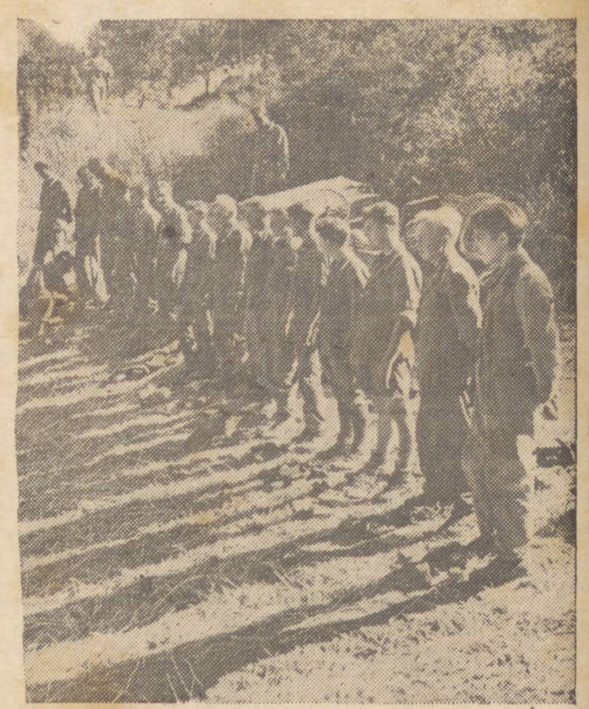
NAZISTAS APRISIONADOS — Em sua brilhante arrancada contra o sul da Itália as tropas aliadas fizeram grande número de prisioneiros nazistas que intentaram resistir. Na fotografia vemos um grupo que se rendeu, no momento em que era enviado para um campo de concentração.

De acordo com observadores autorizados, o ataque foi sumamente energético, sendo lançados contra Hannover cerca de dois milhões de quilos de bombas explosivas e incendiárias. Deixaram de regressar às suas bases 26 aparelhos.