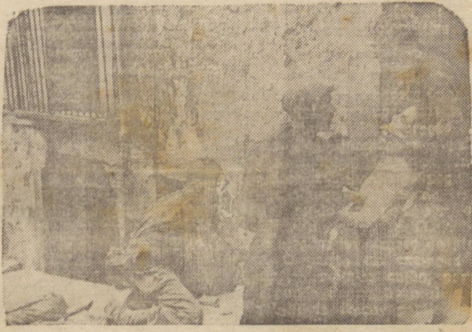
FERIDA PELOS NAZISTAS — Um médico do exército dos Estados Unidos administra os primeiros curativos a uma italiana ferida por um franco atirador nazista. Estes crimes em breve serão vingados.