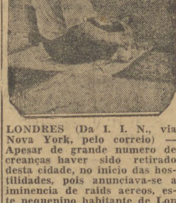
LONDRES (Da I. I. N., via Nova York, pelo correio) — Apesar de grande numero de creanças haver sido retirado desta cidade, no inicio das hostilidades, pois anunciava-se a iminencia de raids aereos, este pequenino habitante de Londres sentase, despreocupadamente, observando o trafego de veículos que vão e vêm. Foram feitos desenhos especiais, em quadros pretos e brancos, para guiar os motoristas, em casos de anormalidade.

Agradecemos a gentil acolhida que nos foi dispensada pelo illustre militar e temos a grata satisfação de transmitir à cidade a saudação que o mesmo dirigiu ao seu povo.