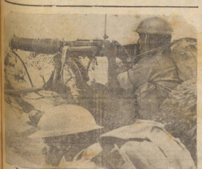
OS INGLEZES GARANTEM OS SEUS SUPRIMENTOS DE PETROLEO NO IRAN.

Soldados da seção de metalhadores de um regimento britânico, cobrindo com a proteção do seu fogo o desembarque de tropas inglesas numa das margens do rio Shatt-al-Arab, na Ilha de Abadan, a entrada do Golfo Persico, para onde as mesmas foram enviadas afim de garantir a refinaria anglo-iraniense de petróleo ali instalada. Essa refinaria, uma das maiores de todo o mundo, figurava entre os primeiros objetivos das forças britânicas que desembarcaram no Iran, onde se encontraram com os destacamentos russos afim de garantir a expulsão do paiz dos nacionalistas do "eixo".