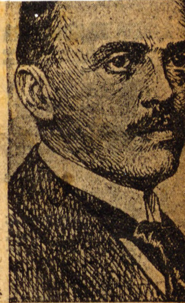
O DR. MUNHOZ DA ROCHA, que se manifestou pela candidatura do sr. José Americo