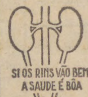
SI OS RINS VÃO BEM A SAÚDE É BOA

O uso do HELMITOL de Bayer é providencial para os rins; limpa-os e desinfeta-os, assegurando o bem estar presente e garantindo uma velhice sadia e sem achaques - uma velhice que se esquece do numero dos anos.