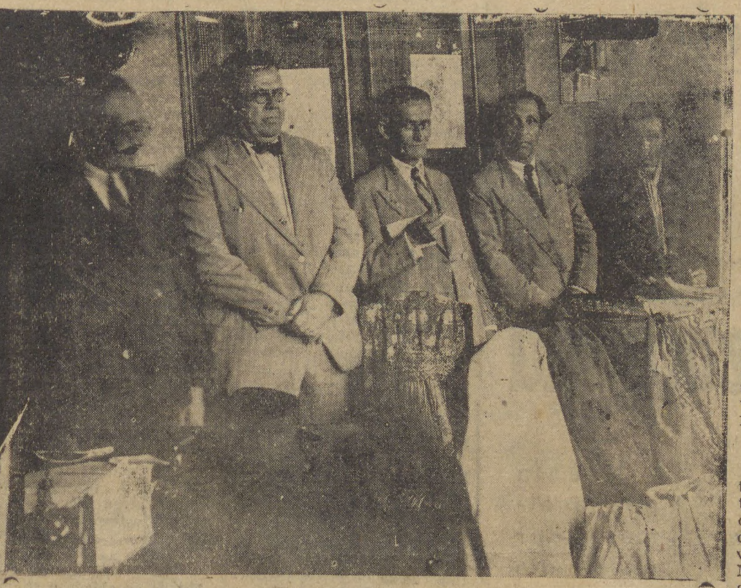
O que a policia conseguiu salvar das unhas da quadrilha...