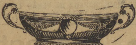
Lindas Jardineiras Fructeiras Apparelhos de chá e café e muitos artigos em metal