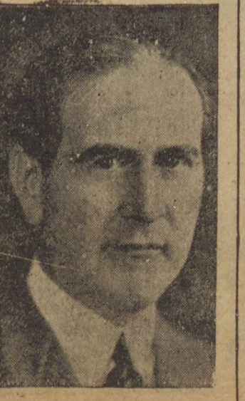
Embaixador Oswaldo Aranha, que está estabelecendo as negociações com os Estados Unidos.

O tratado commercial americano-brasileiro RIO, 22 (D) — Nos circulos financeiros administrativos dão-se como bastante adiantadas as negociações pa-