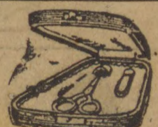
ESTOJOS O que ha de mais fino Macure — Custura Talheres Penteadeira. E para muitas outras utilidades.