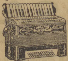
Gaitas e Gaitinhas de bocca e de foles as melhores marcas por menores preços

Não façam suas compras sem primeiro fazer uma visita na Casa Roano Rua 15 N.º 16..