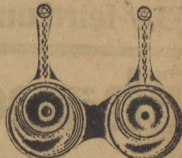
Brincos AFRICANOS Os ultimos modelos de infinidade de gostos, em Ouro e fantazia.