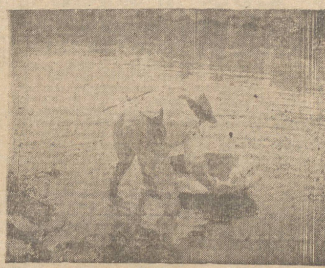
UM GARIMPEIRO PENEIRANDO O CACAIBO

Por medidas que os milharões chamam de "econômicas", o diamantário suspendeu de serviço cerca de 200 lapidadores do Distrito Federal e outros 200 em Petrópolis. Foram mandados para casa — são eles próprios que vieram dizer — sem socorros em salários passando fome, miseráveis, diante da crise fantástica que envenena a vida quotidiana do trabalhador! De que viverão esses homens que só salem lapir diamantes, diante da existência? De que vão viver operários, cuja profissão honesta tem sido a base de todo o orgulho local e de uma civilização fictícia e desumana? O que fará o Ministério do Trabalho, feito em boa hora para proteger os trabalhadores fracos diante de opressões, como esse, por parte dos poderosos financistas e negociantes? Passando privações, pelo fato de terem perdido o lucro fabuloso de seus especuladores de pedras acambradores de galimpos? Ficarão na miséria, como operários de carteira profissional, somente porque não têm o ordeno e o prego pragueta? E as suas famílias? E a comida que terão de gastar de vestir? E o dever humilde da Pátria em amparar