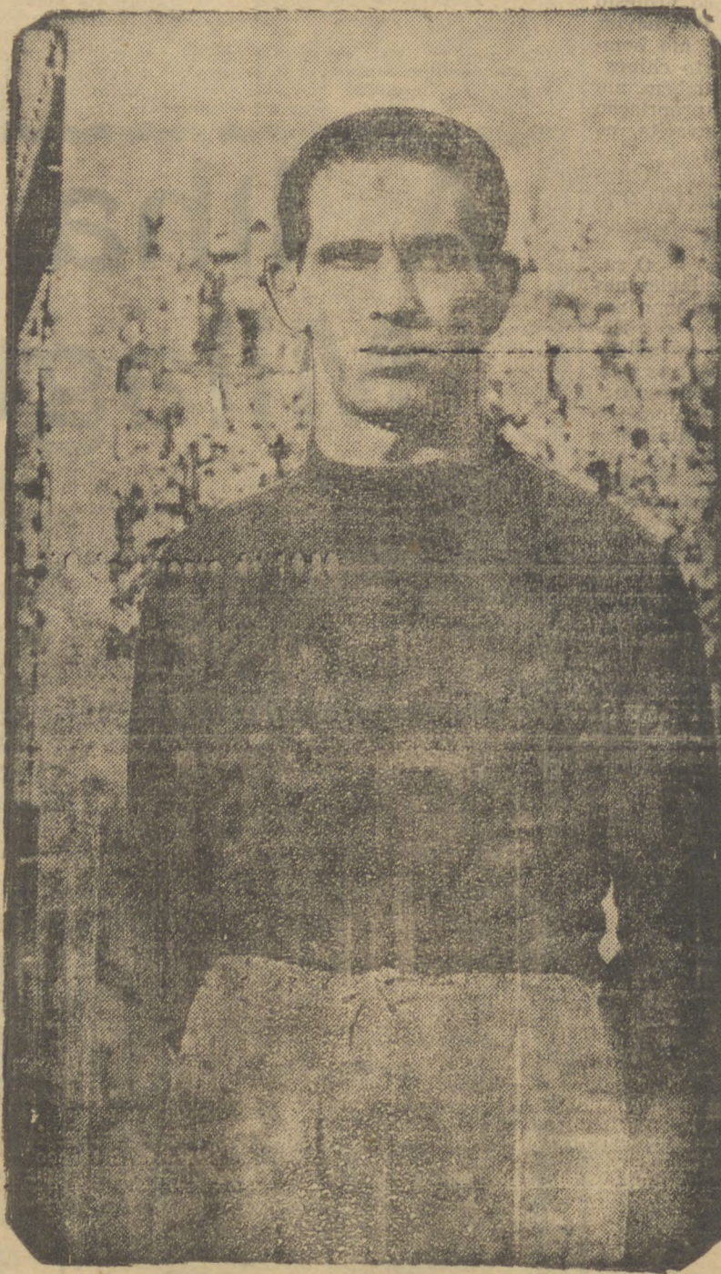
Botafogo e Fluminense no es

tadio da rua Alvaro Chaves, realizarão o jogo mais importante da tarde. No gramado da rua Campos Sales, America e São Cristovam disputarão outro match