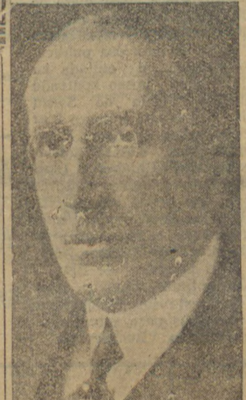
Sr. Arthur Bernardes

CURITYBA, 11 (Successal) — Vae ser installada aqui, dentro em breve, uma potente estação de radio diffusora, de 2 mil watts.