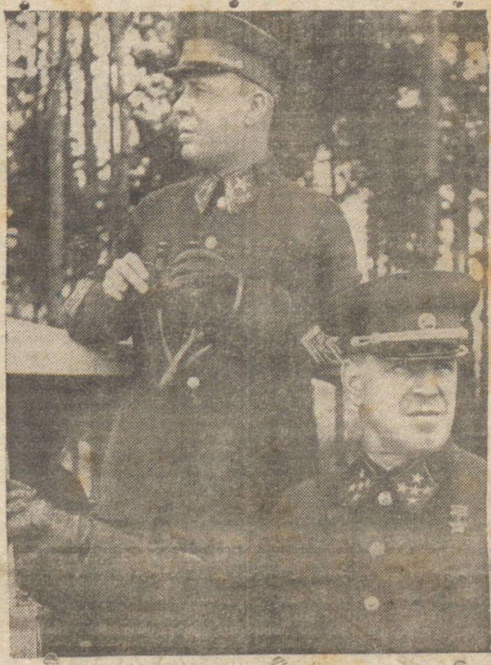
O general Simeon Timoshenko (à esquerda), ao lado do general Grigory Zhukov

MOSCOU 31 (U. P.) — A ofensiva desencadeada pelas forças do marechal Timoshenko contra a rica região industrial do Dnieper Petrovsk, na frente sul, prossegue impetuosamente. As unidades russas já chegaram a 100 quilômetros da cidade que leva o nome dessa região, depois de haverem rompido as linhas inimigas em diversos pontos.