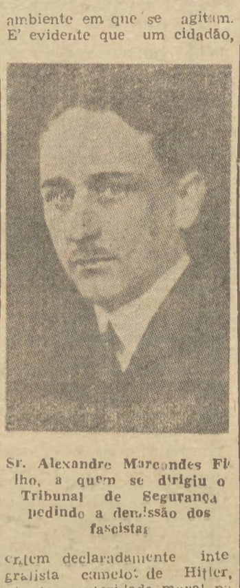
Sr. Alexandre Marcondes Filho, a quem se dirigiu o Tribunal de Segurança pedindo a demissão dos fascistas.

A permanência de integralistas de proa em funções chave é um dos fenômenos atuais a causar maior extraneza no seio da opinião pública. É possível que por algumas figuras do governo, a má repercussão dessa tolerância não seja bem compreendida e julguem assim o descontentamento restrito a círculos mais prevenidos contra o partido mercenário de Berlin. Está errado pensando desse modo. Em primeiro lugar, o povo brasileiro, na totalidade, é prevenido contra o sigma, porque as classes populares sempre souberam encerrar nos chefes carismáticos elementos corolados com a Alemanha para galgarem o poder em nossa terra, apoiar na sua força com o compromisso de lhe servir os desígnios. O tempo não apagou essa certeza, mas a evolução da situação internacional veio comprová-la a afirmação do Presidente Getúlio Vargas de que o assalto de Maio de 28 contra o Palácio Guanabara fora perpetrado sob orientação e comando nazistas.