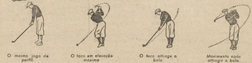
Descreve a curva final.