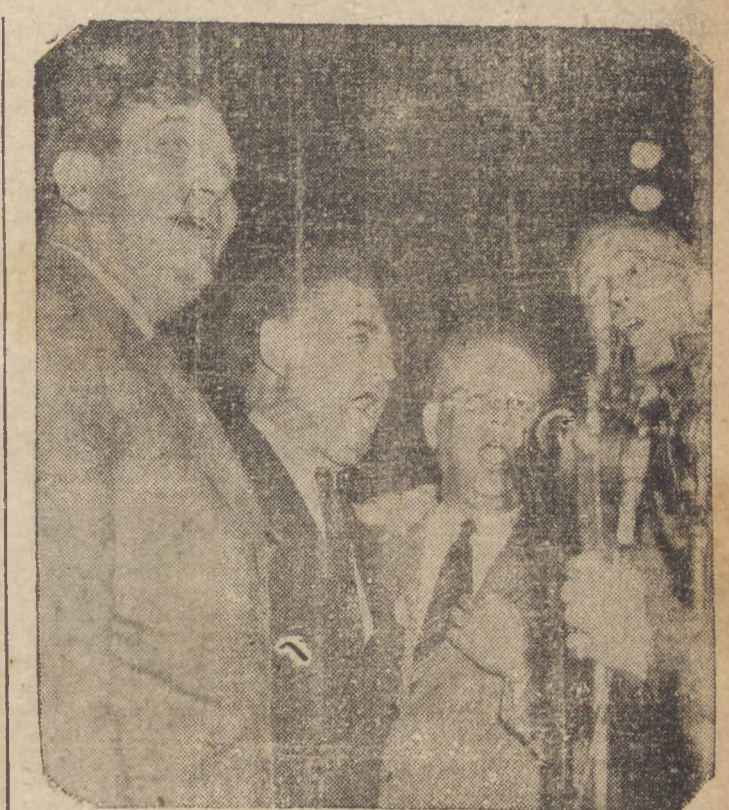
WASHINGTON, Outubro (Illustrated International News). — As preocupações de seu espinhoso cargo não tiram a Mr. Wendell L. Willkie, candidato a presidencia da Republica pelo Partido Republicano, não privam-no de tomar parte em um coro alegre, cantando uma canção regional, durante as suas férias no Colorado. A canção é intitulada "Home on the Range", e é de difícil execução, pois que tem alternativas bruscas de graves para agudos e falsetes. Essa canção é uma das favoritas do sr. Wendell L. Willkie, que surgiu aureolado de grande prestigio popular para a suprema investidura.

Falando á imprensa, o Presidente Roosevelt declarou que os tecnicos e funcionarios especializados estavam estudando a unificação de todos os tipos de material de guerra para os exercitos norte americano e britânico, assim como para a Marinha e a aviação dos dois países. Acrescentou que o programa de auxilio em grande escala á Inglaterra caminha o mais rapidamente possível. Confirmou também a entrega ao Canadá de grande numero de tanques norte-americanos para o treinamento do pessoal canadense e que os canadenses podiam vir aos Estados Unidos a fim de seguir o curso de pilotagem.