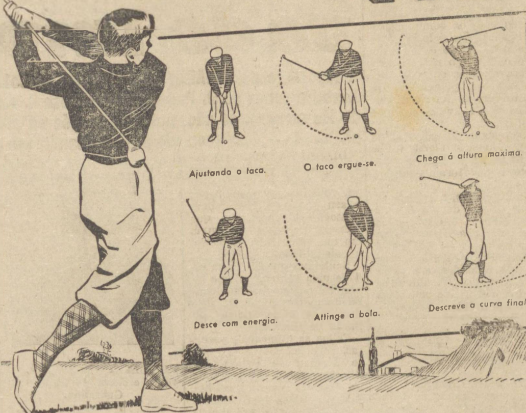
Ajustando o taco.