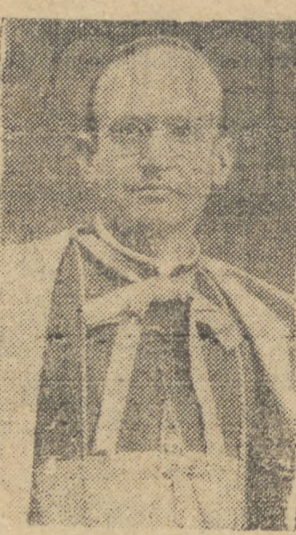
D. Antonio Mazzarotto

Encerraram-se no domingo passado, conforme tivemos occasião de anunciar, os festejos comemorativos do 25º aniversário da ordenação sacerdotal de D. Antonio Mazzarotto, illustre bispo diocesano de Ponta Grossa.