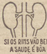
SI OS RINS VAO DEBI A SAUDE É BOA

HELMITOL assegura o bem-estar presente e uma velhice sadia e livre de achaques.