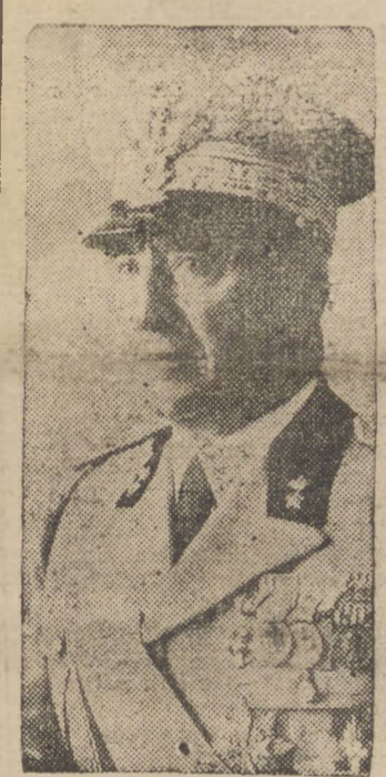
General Pariana, da arma aerea italiana, que opera na Africa

LONDRES, 26 (A. N.) — A Aviação britânica bombardeou a base italiana de Tobruk. Instalações portuarias foram atingidas em cheio.