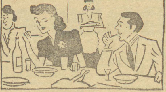
1 - Eu pisco pra meu marido, em casa da Da. Xandóes, quando chega, solene, a maionese... E ele entende... Como faz falta nas refeições o delicioso, o incomparável Óleo de Semente de Algodão Letizia!