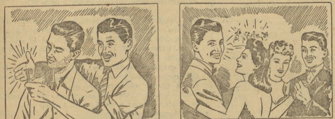
Ficaste com água na boca? No teu caso, o que resolve é a Gillette... A aparência, meu caro, é tudo!

MIRE-SE no espelho dos que sabem atrair afeições e conquistar simpatias! Nunca saia à rua com a barba por fazer! Se quer triunfar na vida social e nos negócios, barbeie-se em casa, todos os dias, com Gillette. Poderá formar ao lado dos que sabem vencer! Adquirá, hoje mesmo, o novo aparelho Gillette Tech e habitue-se a usá-lo, diariamente, com as lâminas Gillette Azul, legítimas.