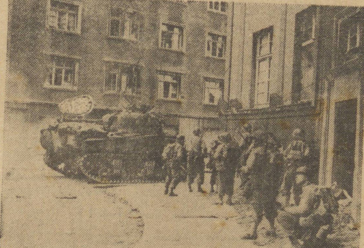
A BATALHA DE AQUISGRAN — A infantaria dos Estados Unidos auxiliada pelos tankselimina os últimos defensores nazistas de Aquisgran, Alemanha.

POSTOS EM LUTA NADA MENOS DE 200 MIL HOMENS PARIS, 31 (U. P.) — Urteinte — Mais de 60 mil soldados americanos estão atacando entre as fronteiras de Luxemburgo e Kesternic, procurando dificultar a retirada alemã em direção a linha Sigfried. PARIS, 31 (U. P.) — 125 mil homens estão avançando sobre a linha Sigfried. No setor dos Ardenes desenvolve-se pouco a pouco a nova ofensiva aliada no oeste. O 1.º Exército lançou mais 4 divisões ou sejam uns, na linha de frente do 1.º exército. Avançando através das florestas de Monschau, sob uma constante tempestade de artilharia, os homens ampliaram a frente de ataque a linha nazista, para 65 quilômetros. Ao sul do rio, o g. P. Patton lançou outras duas divisões 20 kms a leste de Llevainx.