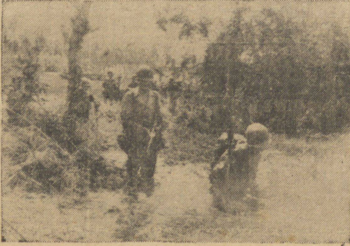
O AVANÇO EM LEYTE — Infantaria dos Estados Unidos avança pela selva na ilha de Leyte, no Pacífico — FOTO S.I.H.