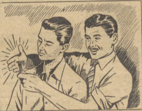
— Ficaste com água na boca? No teu caso, o que resolve é a Gillette... A aparência, meu caro, é tudo!