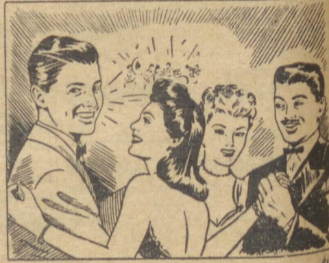
— Gillette resolve! Já vi que o namôro pegou... Ele está tendo a prova de que o meu conselho foi bom...